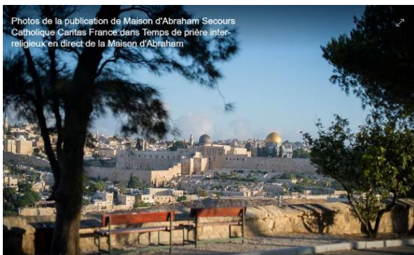
Photos de la publication de Maison d'Abraham Secours Catholique Caritas France dans Temps de prière inter-religieux en direct de la Maison d'Abraham

Mardi 21 avril 2020 – 18h (heure de Jérusalem)